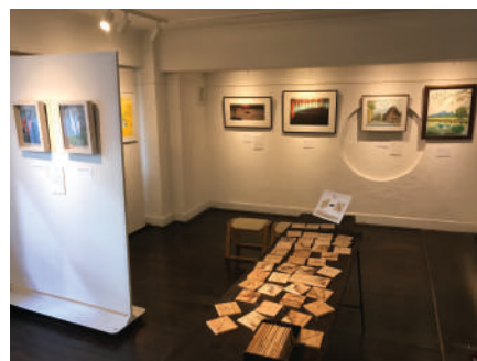
前回の展示風景（同会場） 作品の映える明るいギャラ リーです

築84年、銀座でも屈指のレトロさを誇る 奥野ビルは、今では多数のギャラリーが入居 するギャラリービルとなり注目されています